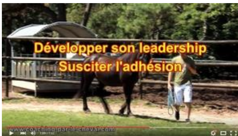
Equicoaching : Développer ses potentiels grâce au coaching par le cheval Vidéo : cliquez ICI

Un coach professionnel vous accompagne pour analyser vos ressentis et mettre en perspective les transpositions dans votre vie personnelle ou professionnelle .